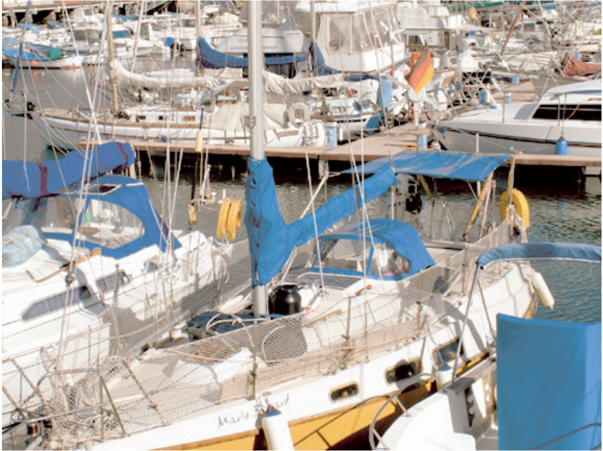
Auf dem Atlantik